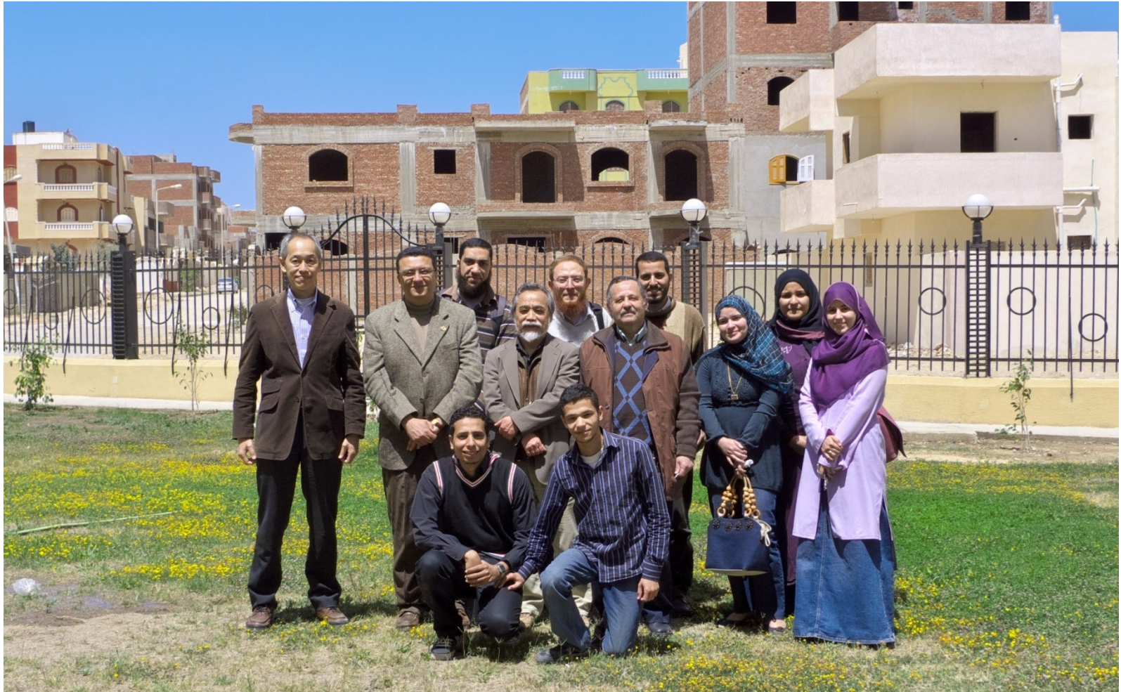
大学院1期生と教員