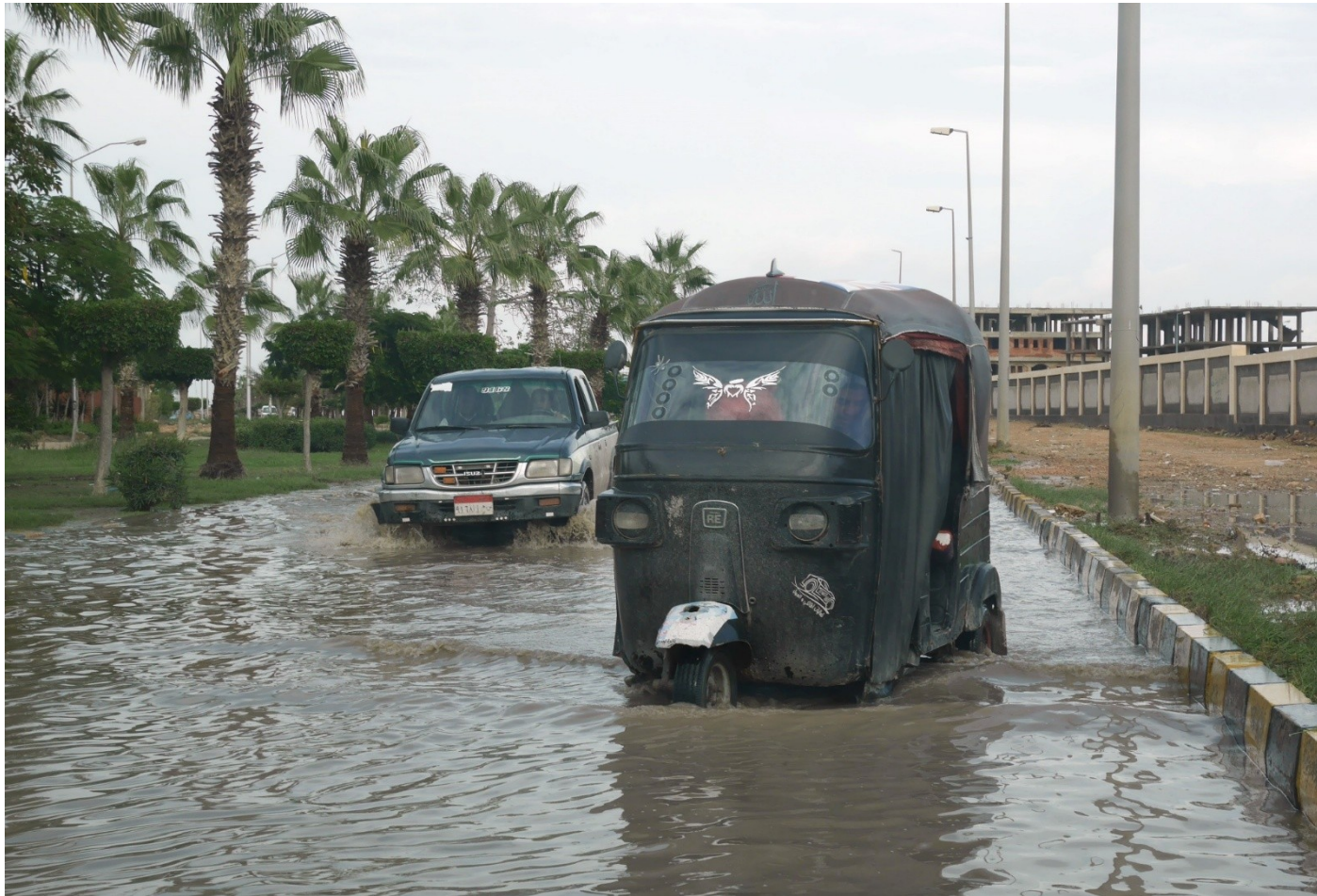
反対車線洪水につき（本来は右側通行）